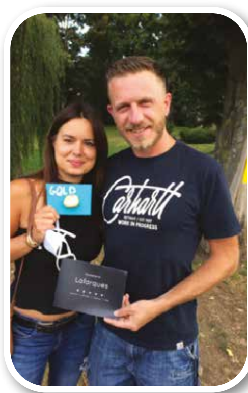
Les gagnants de la 'Gold'