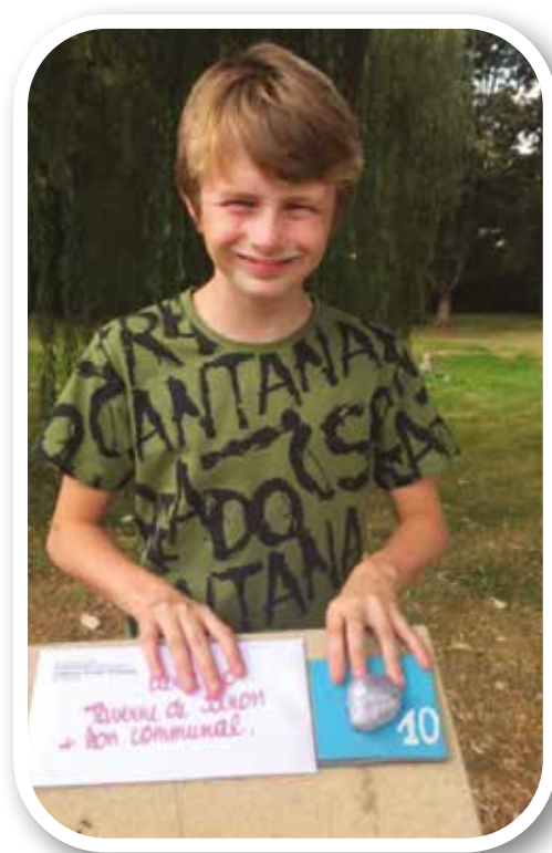
Un de nos amis de Visé